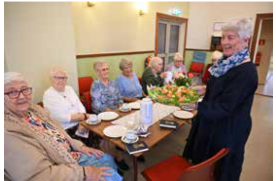
Snitter fra Haugetun var kjøpt inn til det siste møtet.

(En av medlemsorganisasjonene i GuttogJente er Acta)