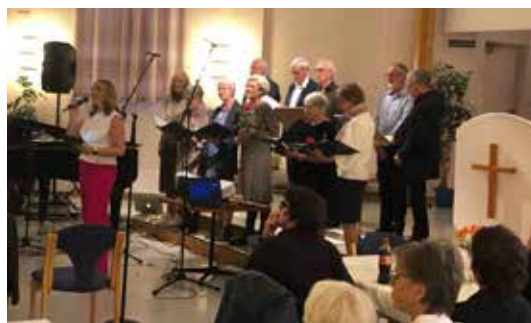
BethelTeamet under 50-årsjubileet.

– Vi har alltid lagt vekt på forkynnende og gode