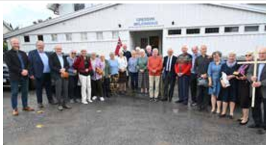
Alle samlet utenfor etter avvigslingen.

Bedehuset har gjennomgått flere endringer og restaureringer. Så tidlig som i 1914 ble parafinovnen byttet ut. Vann ble lagt inn i 1946, mens det først i 1961 ble innredet garderobe og lagt inn vannklosett. En stor restaurering av storsalen ble gjort i 1970 og vaktmesterleiligheten ble satt i tidsmessig stand seks år senere.