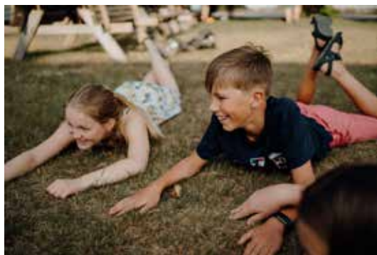
Daniel og Hedda. Illustrasjonsbilde.

Etter man har fullført LTS kurset og begge praksis-leirene, er man kvalifisert til å være med som leder på våre leirer og man mottar et kursbevis.