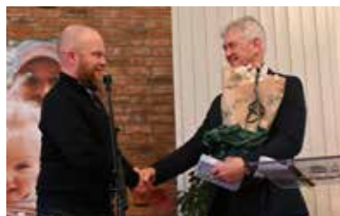
Bildet er fra seansen med takk under regionårsmøtet.

Det er min hyggelige oppgave – som din etterfølger – å si deg en varm takk for din innsats som ansatt i Normisjon region Østfold, også her i bladet. Du gikk rett fra vervet som regionstyreleder til stillingen som administrasjonsleder og i februar 2018 ble du regionleder, fram til 1. november i fjor da du gikk av med pensjon. Du har mange sterke sider, ikke minst økonomisk og administrativt, som du har brukt. Men du er som poteten, som kan brukes til det meste. Du har blant annet gledet mange med sang og musikk, og inspirert gjennom taler og misjonsinformasjon. Vi vet at vi fortsatt kan dra veksler på deg. Guds velsignelse i liv og tjeneste.