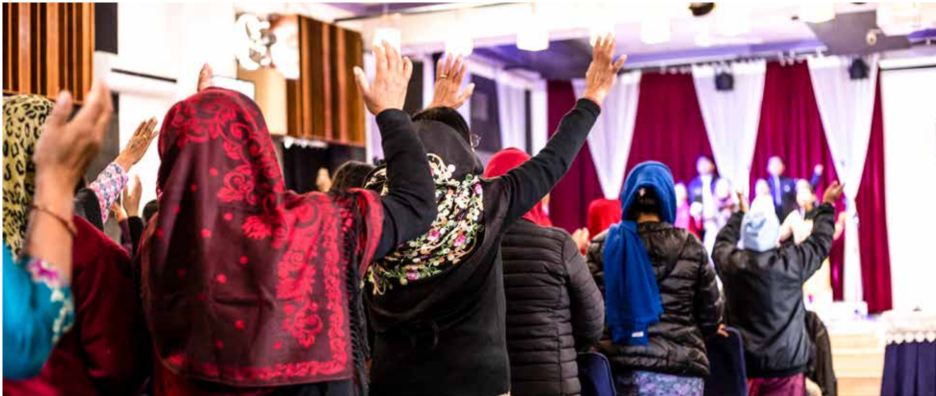
Lovsangen runger i hele bygningen når det er gudstjeneste i kirken i Patan