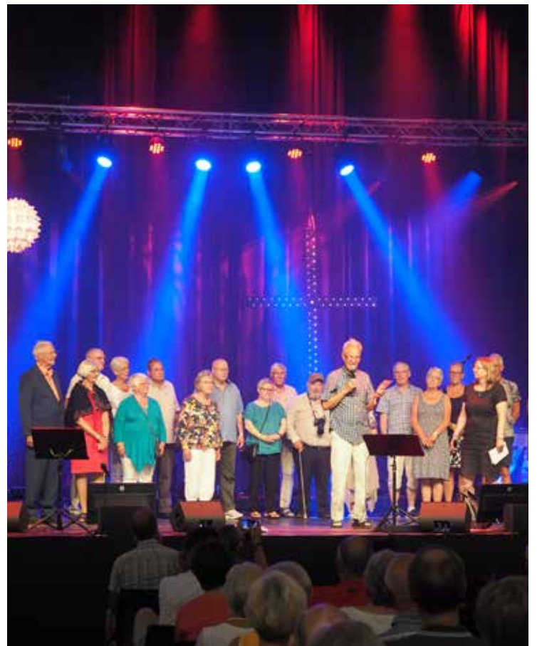
Mange tidligere misjonærer til Ecuador var samlet for å markere jubileet på Normisjons generalforsamling i sommer.