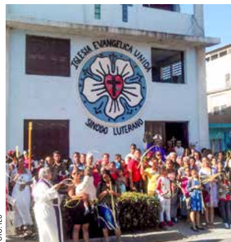
Glade kirkemedlemmer på Cuba!

– For IEU betyr dette en trygghet for at vi er del av det internasjonale lutherske fellesskapet. Vi er ikke alene lenger, vi er i følge med andre, sier biskop Ismael Laborde Figueras.