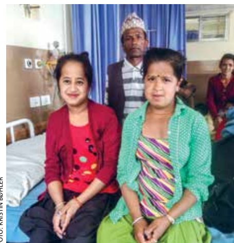
Ambika passer på søsteren. Hun ble operert og sendt hjem etter kort tid.

Hvordan kunne far ha sørget for behandling til sine barn om det ikke var for pasientstøtten ved Okhaldhunga sykehus?