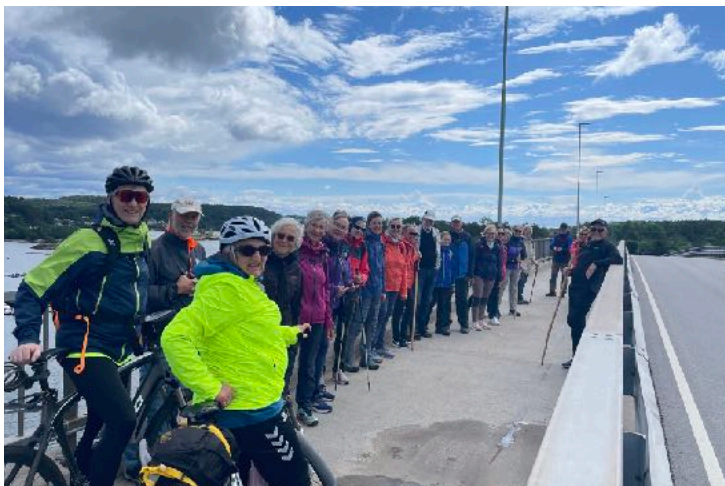
Vi nærmer oss målet. Her går vi over Vrengen bro og tar fatt på de siste få kilometerne mot Verdens Ende.