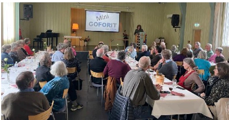
Rundt 60 personer samlet til Medarbeiderfest i forlengelsen av årsmøte på Gol.