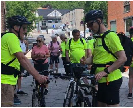
Flere syklet etappene. To av syklistene fullførte alle 10 etapper.