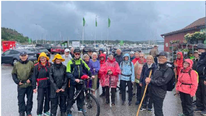
Det kom litt regn noen av dagene, men ikke mer enn at humøret holdt seg på topp. Et buss-skur like i nærheten reddet oss rett etter at dette bildet ble tatt.