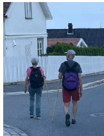
Vandring gjennom Larviks gater.