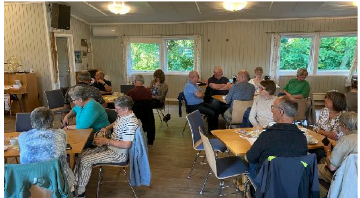
En av mange møter og samlinger underveis. Her fra Quizkveld på Spiderhuset i Holmestrand.