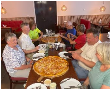
Aldri har denne gjengen blitt servert så store pizzaer.