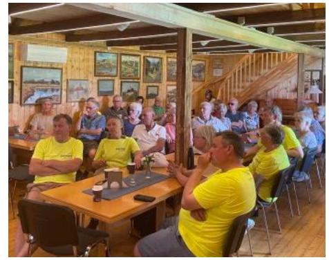
Samarbeid med historielag og bibliotek. Her fra samling med Tjølling Historielag.