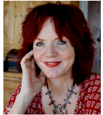
Mari Maurstad med sine tolkninger av Peer Gynts kvinner.