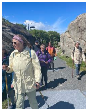
Målet er nådd! Mer enn 50 var med å gå de siste kilometerne til Verdens Ende. Seks personer fullførte alle 10 etapper.