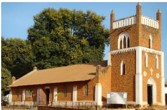
Kirken i Ngaoundéré som sto ferdig i 1964.