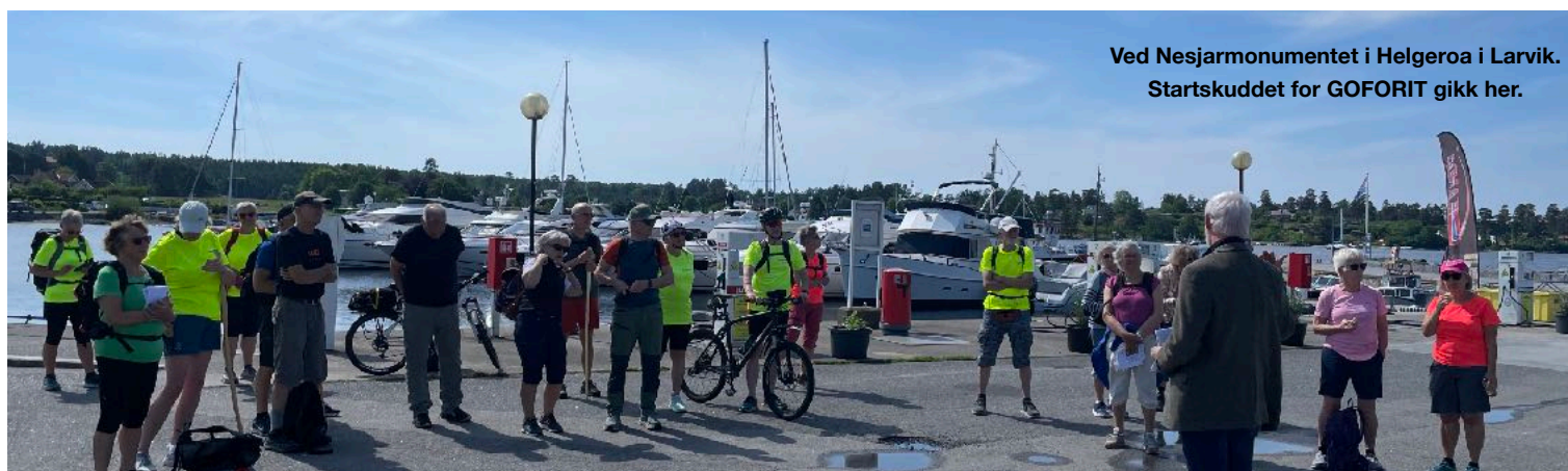
Ved Nesjarmonumentet i Helgeroa i Larvik. Startskuddet for GOFORIT gikk her.