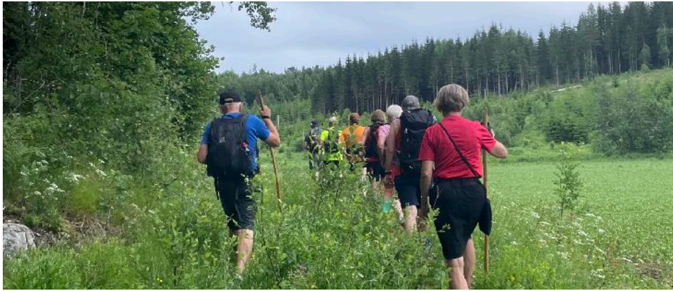
Et feil veivalg ved Kodal kirke førte oss inn på ukjente steder. Litt lenger tur ble det, men alle var enige om at dette ble en uforglemmelig dagsetappe.