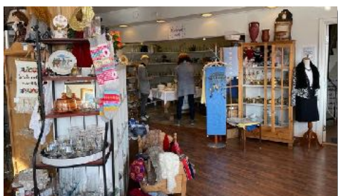
Galleri Normisjon Ål har flotte butikklokaler på Evjens Minne.

I midten av mars var staben i Hallingdal og besøkte butikken i Ål. Vi fikk høre om hvordan oppgaver fordeles og dagene i butikken organiseres. Galleri Normisjon Ål er butikken med nest størst overskudd av samtlige Galleri Normisjonsbutikker og