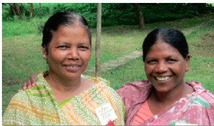
Lederne i WPW, Bimola og Monjulika.

Kanskje du har en bønneliste og ber flere ganger daglig? Eller kanskje du