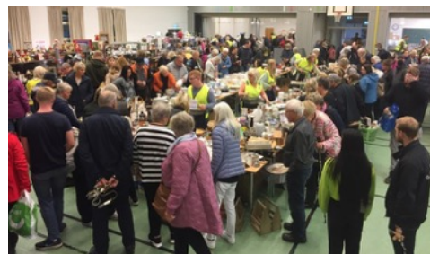
Fra loppemarkedet på Gjennestad vgs.