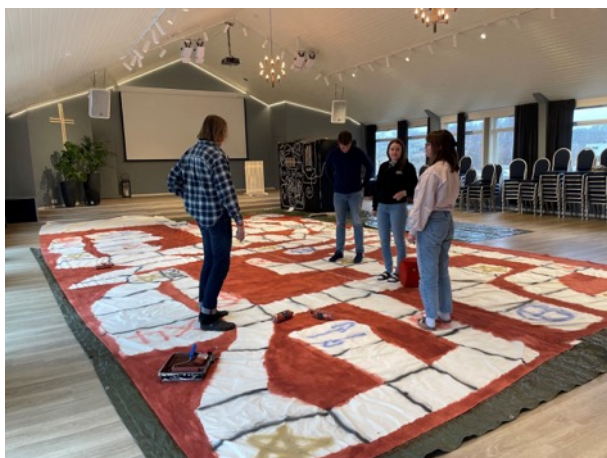
Ettåringene med siste finpuss før LevelUp lanseres.

har bygget et mobilt fengsel som skal fungere som et «escaperoom», dette tas inn i prosessen de har startet med å skape sitt eget leirkonsept.