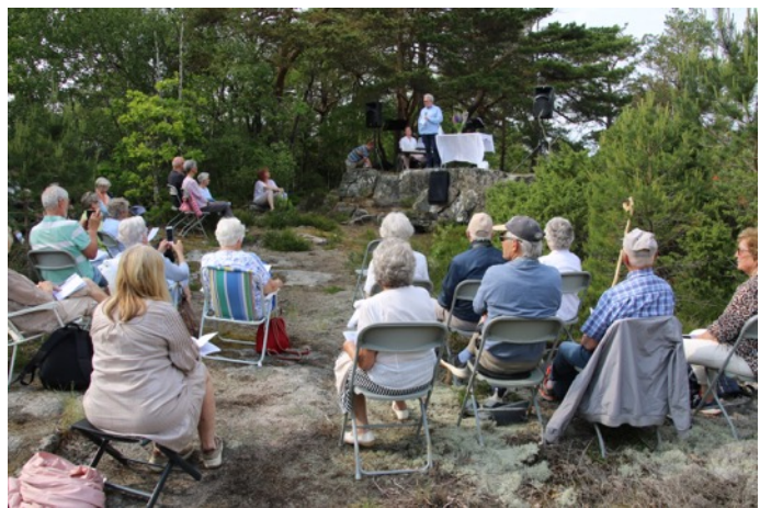
Fra festgudstjenesten på Gamleffjell i forbindelse med 150 års-markeringen for Haabets forlis.

Nevnes kan også festgudstjenesten og avdukingen av minneplaten vi hadde på Gamleffjell i juni. Både generalsekretær i Normisjon, ordfører i Sandefjord og prost i Sandefjord menighet deltok på markeringen av at det var 150 år siden selfangstskuta "Haabet" forliste. Senere dette året ble regionlederen invitert til å ha foredrag om Haabets forlis både på Hvalfangstmuseet i Sandefjord og på Slottsfjellmuseet i Tønsberg.