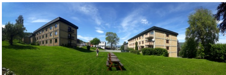
Danvik folkehøgskole i Drammen, en av Norges største folkehøgskoler.