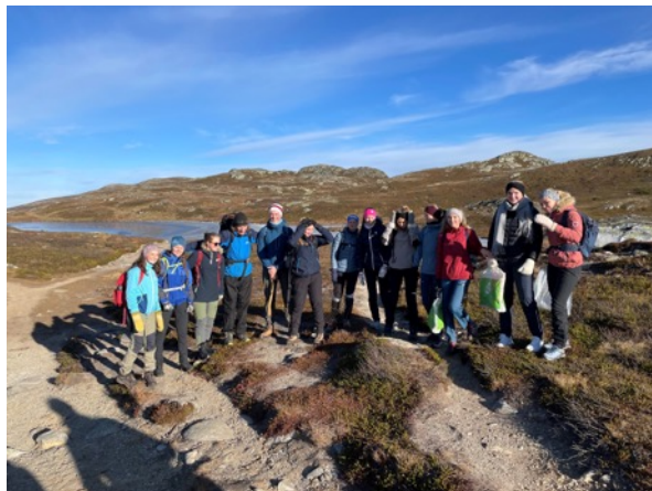
LIFT-gjengen på Veggli.

Første LIFT helg besto av 12 deltakere, og turen gikk til Veggli. Her hadde vi fine dager med aktiviteter, undervisning og sosialt. Vi opplevde at denne helgen viste oss noe om hva som kan komme ut av LIFT. Det ble gode samtaler og gode fellesskap gjennom helgen og flere uttrykte at dette var noe de satte pris på.