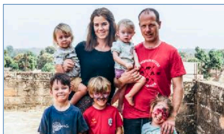
Familien Jøssang Normisjons utsendinger i Senegal