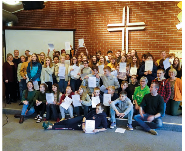
Mye gull på lederkurs...