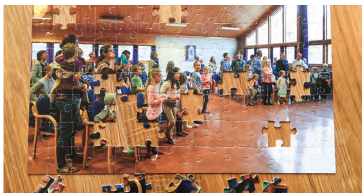
Pusling på weekend: Alle er en like viktig brikke i fellesskapet.

En helg i året fyller vi Stemnestaden til randen og har Storsamlingsweekend i samarbeid med kirken i Suldal. Da står både bibeltimer, møter, egne samlinger for barna og ungdommene, gudstjeneste, festkveld, bønnevandring, bading i Tysværtunet, lek og moro, og masse god mat på programmet.