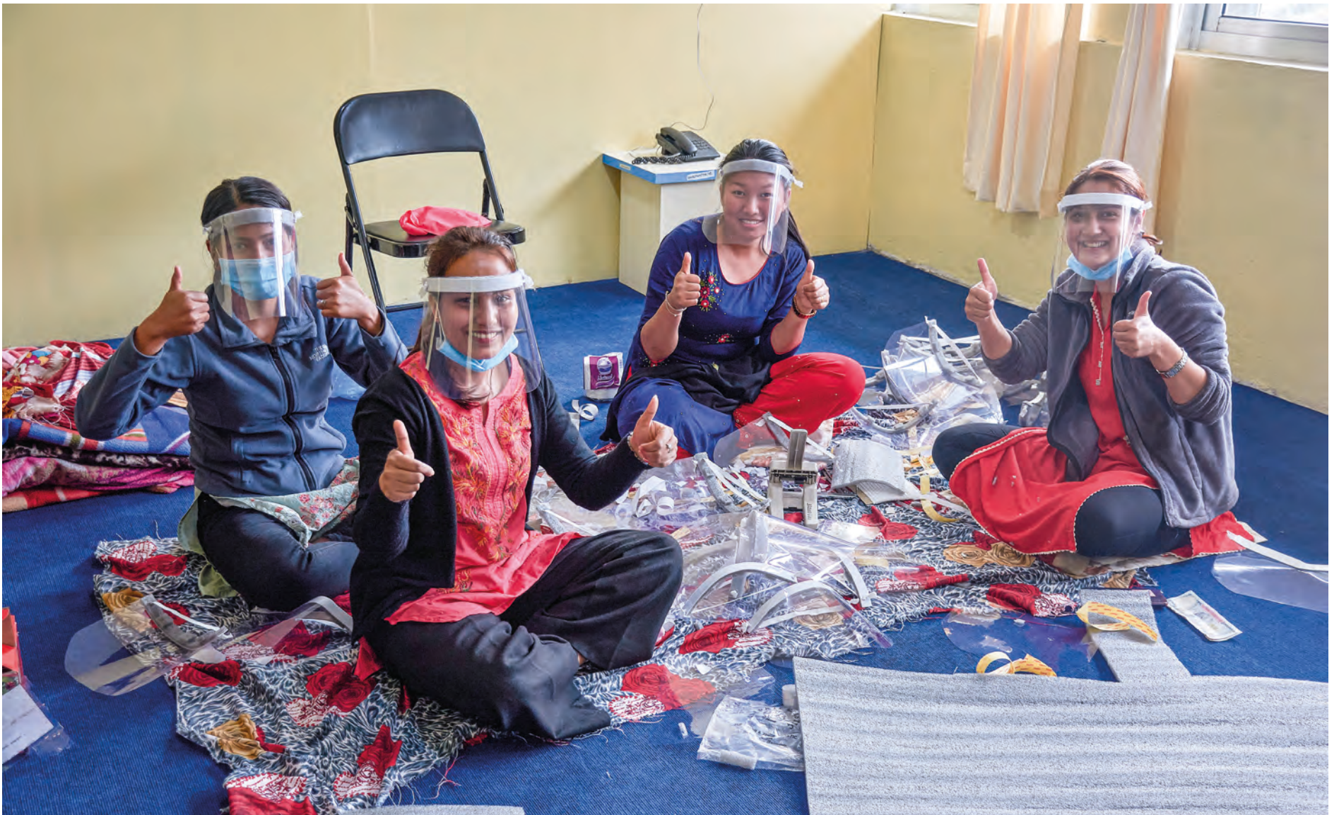
I Okhaldhunga arbeides det for fullt med å produsere verneutstyr i påvente av at koronaepidemien kan komme også dit.